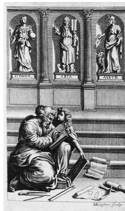
Μάθημα Γεωγραφίας με δεσπόζουσες τις αλληγορικές μορφές της Ευρώπης, της Ασίας και της Λιβύης. Χαρακτικό στην προμετωπίδα της έκδοσης: Διονυσίου, Οικουμένης περιήγησις , Οξφόρδη, S. Smith & B. Walford, 1697.

Αν μια χαρακτηριστική ιδιομορφία της συλλογής της Βιβλιοθήκης της Κοζάνης είναι ότι συγκροτήθηκε, σχεδόν αποκλειστικά, από δωρεές, κυρίως των λογίων Κοζανιτών αποδήμων στις χώρες της Κεντρικής Ευρώπης, όπως και των τοπικών αξιωματούχων, θρησκευτικών και κοσμικών προσωποτήτων της Μητρόπολης Σερβίων και Κοζάνης, το αφήγημα του Μουσείου προσπάθησε να ερμηνεύσει τη συνθήκη αυτή. Ωστόσο στόχος απώτερος του Μουσείου, πέρα από την ερμηνευτική προσέγγιση του μουσειολογικού αφηγήματος γύρω από τον μεγάλο και μοναδικό για τον ελληνικό χώρο πλούτο της Βιβλιοθήκης, είναι η ενίσχυση της αυτοσυνειδησίας και ταυτότητας της πόλης και των ανθρώπων της.