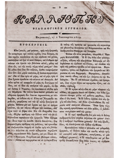
Το πρώτο φύλλο (1 Ιανουαρίου 1819) του περιοδικού Καλλιόπη τυπώθηκε στη Βιέννη από την Ελληνική Τυπογραφία του Χιρσεφελντ.

κά δείγματα της πνευματικής έκφρασης, αλλά και της τυπογραφικής εκδοτικής δραστηριότητας του Γένους από τον 15ο αιώνα ως τις αρχές του 19ου. Ορισμένες