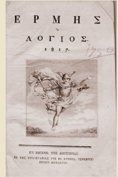
Τόμος του περιοδικού Ermihs o Logios (Βιέννη, 1817, εκ της τυπογραφίας Ιωάννου Βαρθολομαίου Τζβέκιου, πρώην Βενδότου) που θησαυρίζεται στην Κοβεντάρειο Βιβλιοθήκη.

1526, και κυκλοφόρησε σε τουλάχιστον ογδόντα επανεκδόσεις ως το 1800.