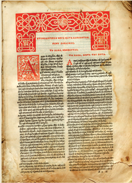
Ερυθρό επίτιτλο και πρωτόγραμμα στην πρώτη σελίδα του κειμένου της έκδοσης: Μέγα Ετυμολογικόν , Βενετία, Federicus Turrisanus, 1549.