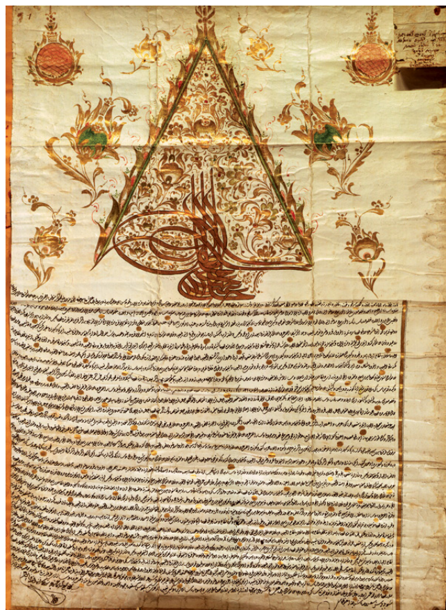
Φερμάνι του σουλτάνου Αμπντούλχαμίτ Α', Κωνσταντινούπολη, 22 Αυγούστου 1785. Τα οθωμανικά έγγραφα που διασώζονται στην Κοβεντάρειο τοποθετούνται χρονολογικά στον 18ο και κυρίως στον 19ο αιώνα.

Πιο αναλυτικά, το Μουσείο Βιβλιοθήκης Κοζάνης διηγείται την ιστορία της βιβλιοθήκης μέσα στο ευρύτερο πλαίσιο της ιστορίας της πόλης και των ανθρώπων της, εστιάζοντας το ενδιαφέρον του επισκέπτη στην περίοδο της Οθωμανικής κυριαρχίας, περίοδο που ταυτίζεται με την ακμή της πόλης αλλά και με την ανάπτυξη της Βιβλιοθήκης. Με τη λογική αυτή παρουσιάζεται η γεωπολιτική θέση της πόλης σε ένα συγκεκριμένο ιστορικό πλαίσιο, διερευνώντας τις σχέσεις της Κοζάνης με την Οθωμανική Αυτοκρατορία, όπως και με τις χώρες της Κεντρικής και Ανατολικής Ευρώπης, όπου ταξιδεύουν και εγκαθίστανται πολλοί έμποροι και λόγιοι Κοζανίτες. Η ανάπτυξη της Κοζάνης αλλά και της βιβλιοθήκης της συνδέεται στενά με τη δράση των απόδημων Κοζανιτών, οι οποίοι βιώνουν και μεταλαμπαδεύουν το πνεύμα του Ευρωπαϊκού Διαφωτισμού στη βιβλιοθήκη και στην πόλη τους, μέσα από δωρεές εκδόσεων, και ευεγερσίες. Εξάλλου η ίδια η