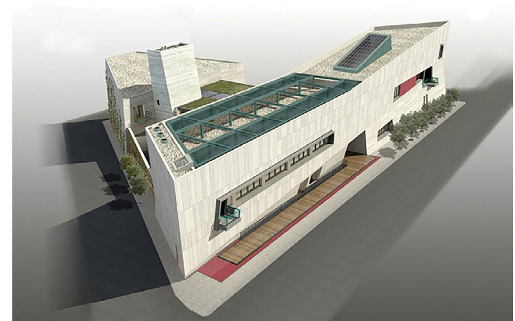
Τριδιάστατη απεικόνιση του κτιρίου, που περιλαμβάνει τη Βιβλιοθήκη (2.328 τ.μ.), το Μουσείο (1.000 τ.μ.) και τους κοινόχρηστους χώρους υποδοχής και εξυπηρέτησης του κοινού (725 τ.μ.).

προσέγγιση τα τελευταία 40 χρόνια, τα αντικείμενα αφηγούνται πολλαπλές ιστορίες μέσα από τη βιογραφία τους, και επιδέχονται διαφορετικές ερμηνείες αναλόγως με το εκάστοτε επιστημολογικό, ιδεολογικό, θεσμικό και πολιτισμικό πλαίσιο. Με αφετηρία τόσο την παραδοχή αυτή όσο και τη διαχρονική σχέση Μουσείου-Βιβλιοθήκης, το Μουσείο Βιβλιοθήκης Κο-