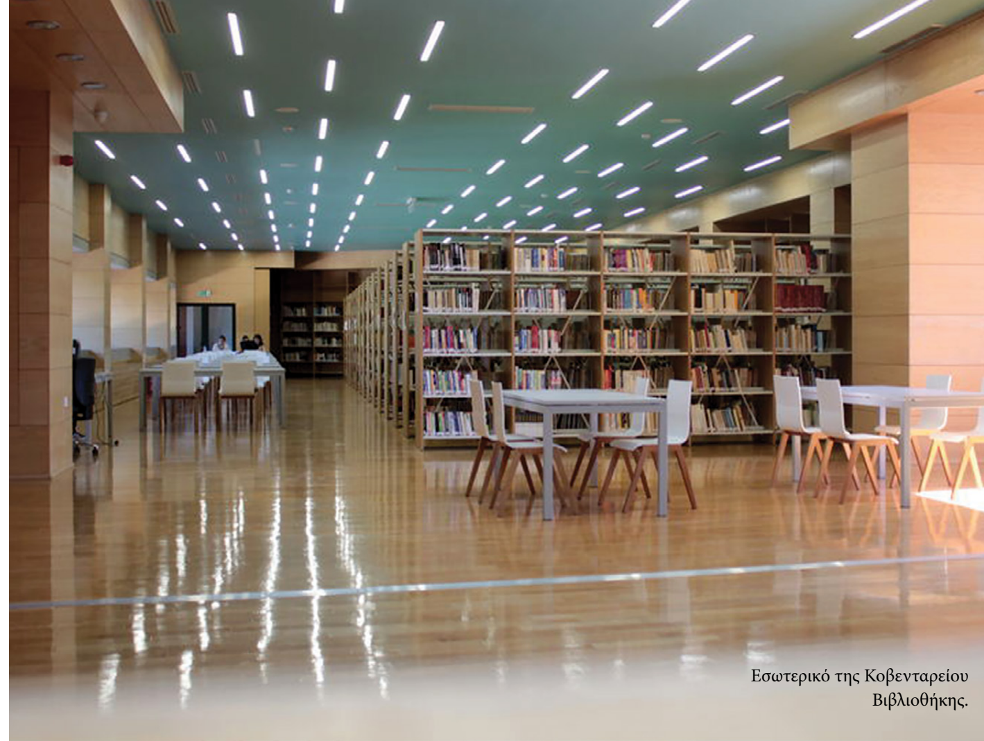
Εσωτερικό της Κοβενταρείου Βιβλιοθήκης.

Ζωτική ανάγκη για την ίδρυση βιβλιοθήκης στην Κοζάνη ενδεχομένως δημιουργήθηκε από τα μέσα του 18ου αιώνα, οπότε άρχισαν να λειτουργούν διάφορες σχολές, όπως της Στοάς (1745–1774), της Κομπανίας (1756–1769) και του Ελληνικού Μουσείου (1776–1797/9), όπου δίδαξαν διαπρεπείς λόγιοι, μεταξύ των οποίων ο Σεβαστός Λεοντιάδης, ο Χρηστάκης από