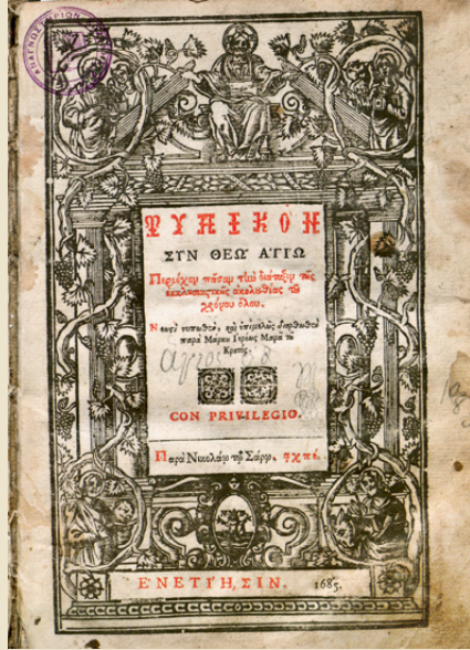
Η σελίδα τίτλου της έκδοσης: Τυπικόν , Βενετία, Νικόλαος Σάρος, 1685.